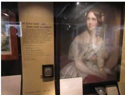
Om H.C.Andersens forelskelse i den svenske nattergal Jenny Lind