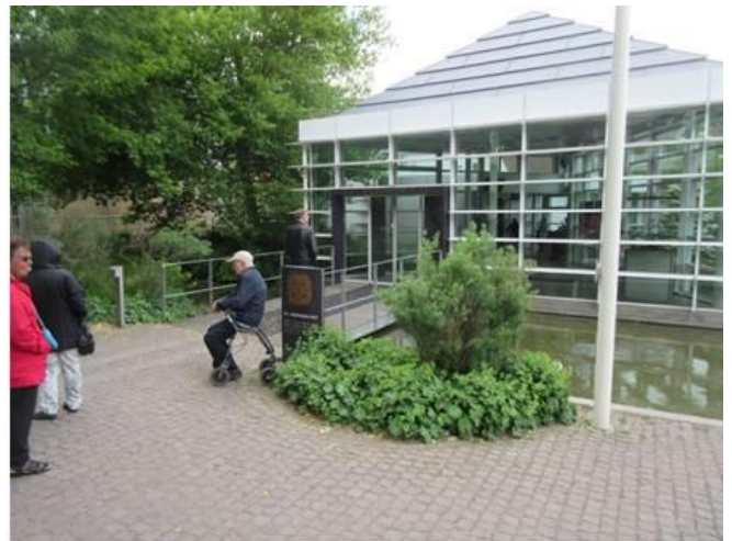
Indgang til H.C.Andersen-museet