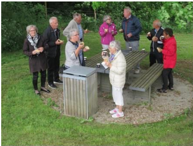
Formiddagskaffe i den fri natur