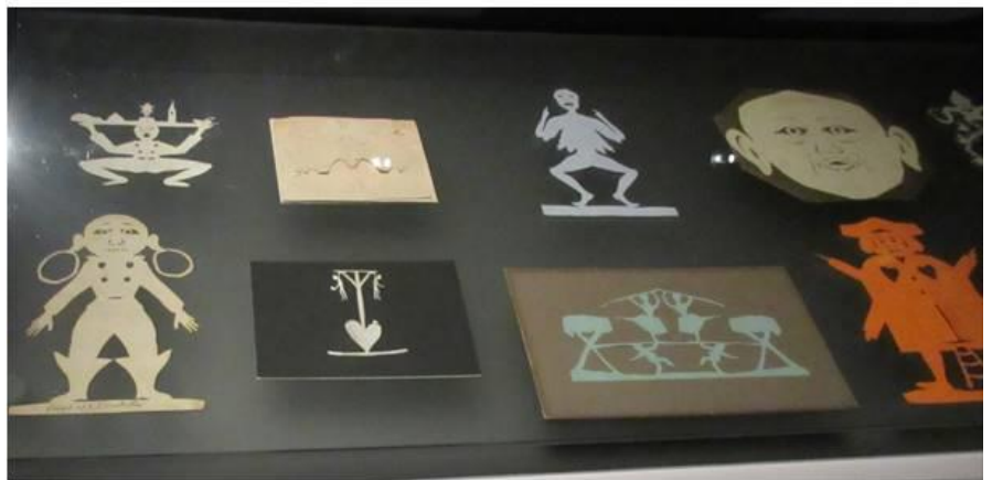
Udsnit af H.C.Andersens papirklip