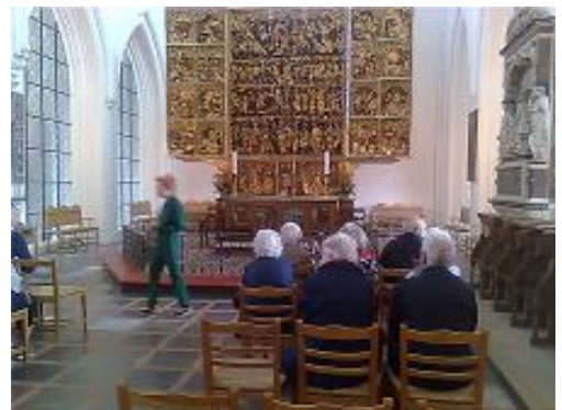
Fra besøget i Sct. Knuds kirke, domkirken.

Igen lykkedes det aktivitetsudvalget at arrangere en vellykket udflugt for menigheden. Hovedattraktionerne naturligvis var H.C.Andersen-museet, som mange sikkert for år tilbage har set. Men gensynet var for de fleste sikkert godt; man havde virkelig formået at få det hele til at virke spændende. Den anden attraktion var Domkirken, Sct. Knuds kirke. Her fortalte en meget dygtig guide os om kirken, skrinet med knogleresterne af Kong Knud den Hellige, som blev myrdet foran alteret d. 10. juli 1086, og meget andet godt.