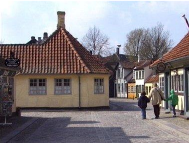
H.C. Andersens hus og domkirken i Odense